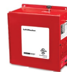
Fire Link release device